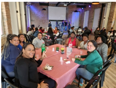
Frauenabend bei educare