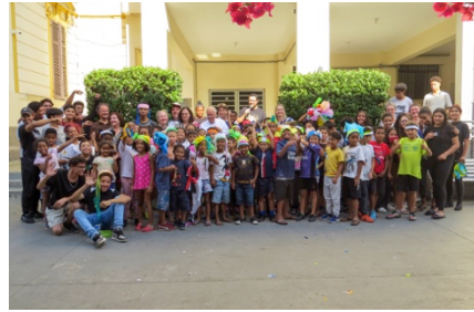
Besuch von unseren Partnern der AEB Stiftung und Rotary