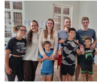
Danke an unsere tollen Lernhelfer