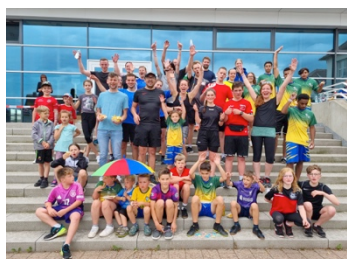
Sponsorenlauf in Pfalzgrafenweiler