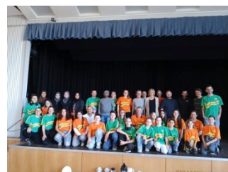
Das Helferteam des Benefizessen in Tunningen