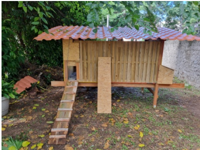
Der neue Hühnerstall von educare