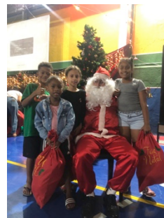
Der Weihnachtsmann kommt zu Besuch