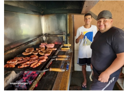
Wochenendfreizeit mit unseren Trainees