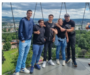
Brasilianische Jugendliche zu Besuch