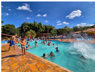
Sommerncamp mit 130 Kindern