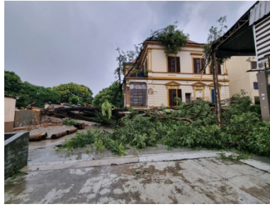
Er hinterlässt große Schäden an Gebäude und Dächern