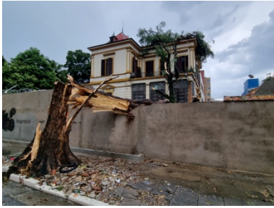
Ein Baum stürzt aufs Gelände